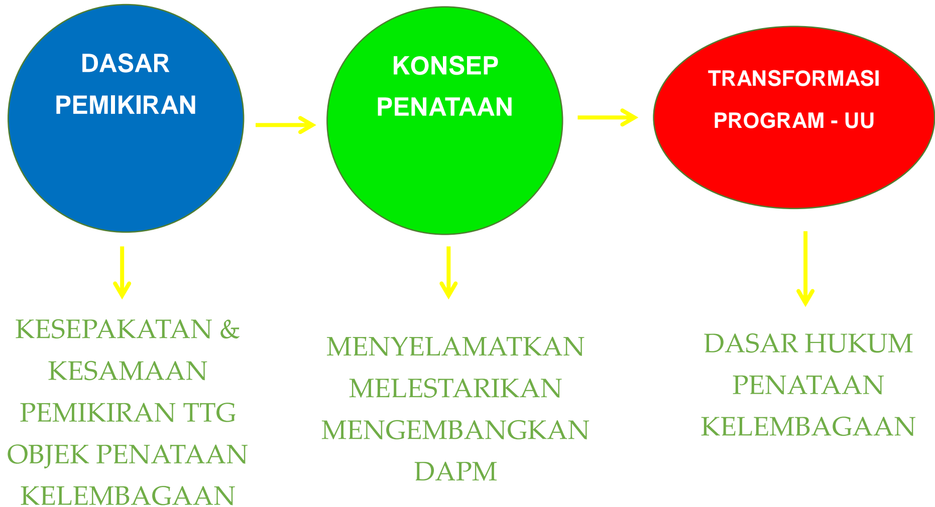
Gambar ; 4.2. Skema Tata Kelola dan Transformasi DAPM – BU MDesa